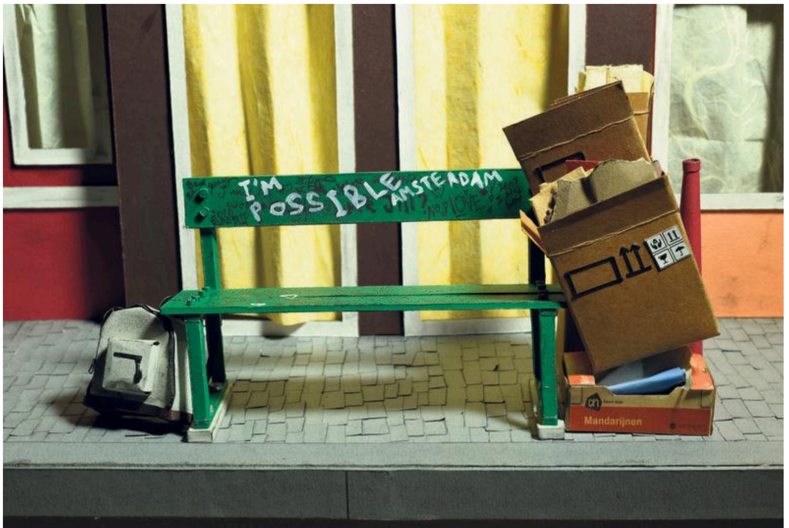
'I'm possible Amsterdam' van Gali Blay.